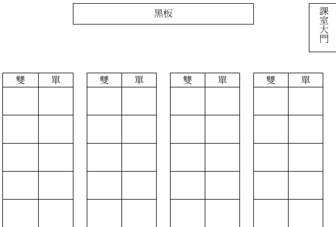
圖一： 課室位置安排